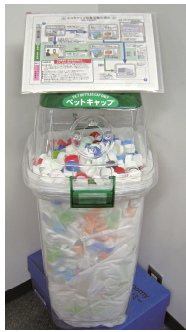
組合本部に設置されている 回収ボックス